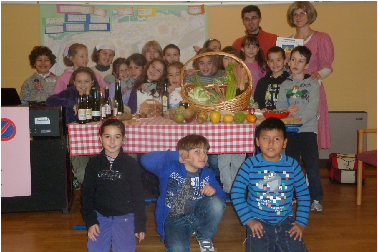
Foto di gruppo

“Non lasciar passare neanche un giorno senza scrivere una riga ”. Plinio il Vecchio